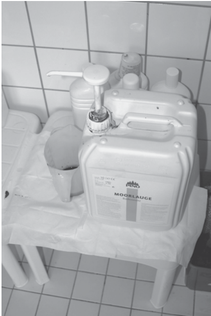
Abb. 4: Abfüllung von Moorlauge