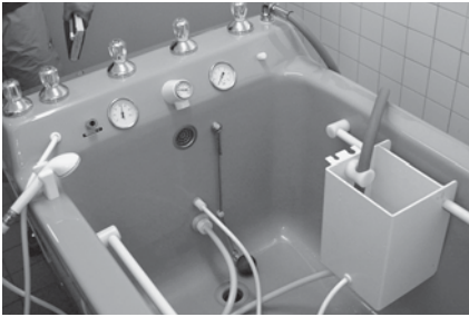
Abb. 5: Einrichtung zur Desinfektion des Pumpenkreislaufs in einer Unterwassermassagewanne