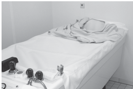
Abb. 2: Abgedeckte Kohlensäurebadewanne

Kohlensäure wird in die abgedeckte Wanne geleitet, in der der Patient auf einem Liegesessel ruht; lediglich der Kopf des Patienten ragt aus dieser Einhausung heraus (Abb. 2). Hier kann keine besondere mikrobielle Gefahr gesehen werden. Voraussetzung ist, die Abdeckung der Flächen, auf denen der nackte Patient aufliegt, einem hygienischen Waschverfahren zuzuführen. Nach der Behandlung ist auch eine Flächendesinfektion aller Wannenteile, die mit dem Patienten Kontakt gehabt haben könnten, erforderlich.