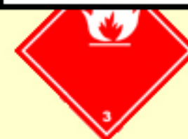
Klasse 3 Entzündbare flüssige Stoffe Nr. 3