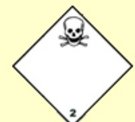
Klasse 2 Giftige Gase Nr. 2.3