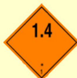
Klasse 1 Unterklasse 1.4 Nr. 1.4