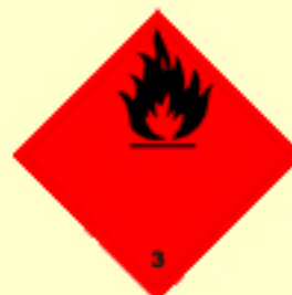
Klasse 3 Entzündbare flüssige Stoffe Nr. 3