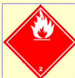
Klasse 2 Entzündbare Gase Nr. 2.1