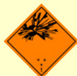
Klasse 1 Unterklassen 1.1, 1.2 und 1.3 Nr. 1