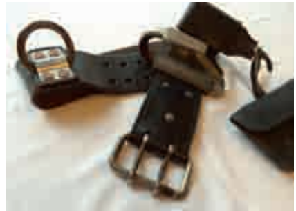
Abbildung 2: Hakengurt nach 1938