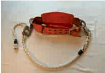
Abbildung 3: Haltegurt EN 358