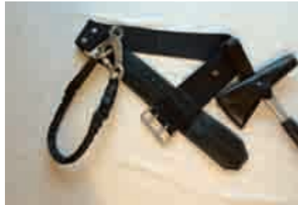
Abbildung 4: Feuerwehr Haltegurt DIN 14927:2005-09 Typ B

Spätestens mit der „Gleichschaltung“ der Deutschen Feuerwehren zur Verteidigung und Luftschutz, vollzogen durch das Reichsgesetz über das Feuerlöschwesen vom 23. November 1938 kam die Weiterentwicklung des damals gebräuchlichen ledernen Feuerwehr-Hakengurt zum Stillstand.