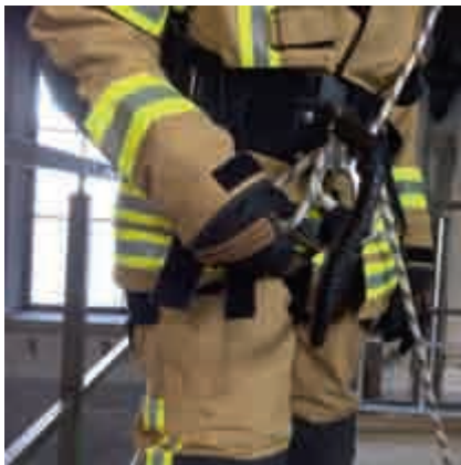
Abbildung 20: Feuerwehr-Haltegurt mit temporären Sitzschlingen

Am Feuerwehrhaltegurt werden entsprechende Vorrichtungen verpackt mitgeführt. Im Notfall werden diese in Betrieb genommen und als Rettungsgurt eingesetzt.