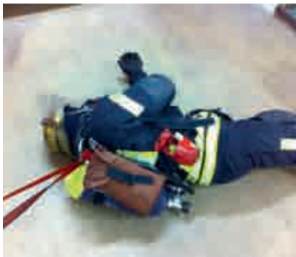
Abbildung 22: Bandschlingen als improvisierte Rettungsschlaufen

Am PA wird eine ca. 1,8 bis 2 m lange Bandschlinge verpackt mitgeführt. Im Notfall wird diese in Betrieb genommen und als Behelfs-Sitzgurt eingesetzt. 1)