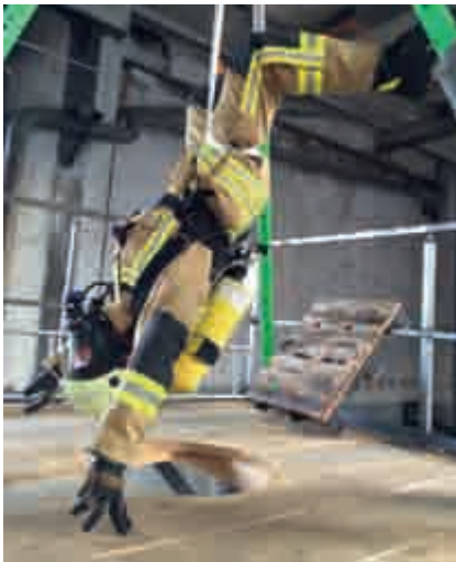
Abbildung 23: Bandschlingen als improvisierte Sitzschlaufen

Nachteile wie die mangelnde Zulassungsfähigkeit, instabiler Anseilpunkt und die gefährliche Körperlage beim Abseilen mit Atemschutz ohne Fußkontakt, hohe praktische Anforderungen zur Inbetriebnahme sowie die fehlende Eignung zum Halten, Rückhalten und Retten von Personen, machen weiterhin das Benutzen des Feuerwehr-Haltegurtes mit all seinen Nachteilen und Belastungen erforderlich und führten zur Einstellung dieser Entwicklung.