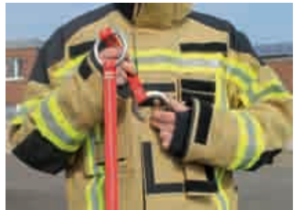
Abbildung 32: Schritt 4