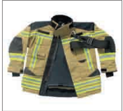
Abbildung 30: Schritt 2