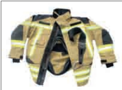
Abbildung 31: Schritt 3