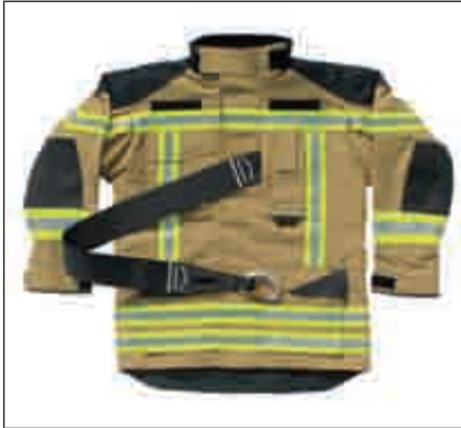
Abbildung 29: Schritt 1

Trageeigenschaften gewährleisten die vollständigen Funktionen der Feuerwehr-Schutzkleidung und des IRS 1) .