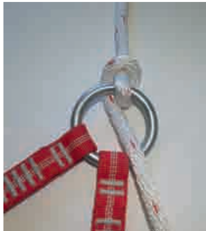
Abbildung 50: Seilverlauf Halbmastwurfsicherung Anschlagring IRS

Abbildung 49: Seilverlauf Halbmastwurf-Abseilung; das einlaufende Seil nimmt die Verschlussrichtung mit und öffnet den Verschluss; die Verschlussicherung wird unwirksam, der Verschluss kann sich öffnen und das einlaufende Seil klinkt aus.