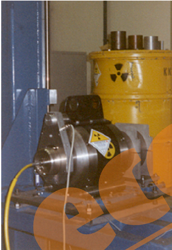
Typ-B-Versandstück für zerstörungsfreie Werkstoffprüfung (sog. Radiogammagraphiegerät) – Gewicht etwa 10 kg