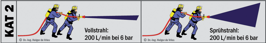
Abbildung 25: Betriebsverhalten eines Strahlrohrs mit variabler Strahlform bei konstantem Volumenstrom