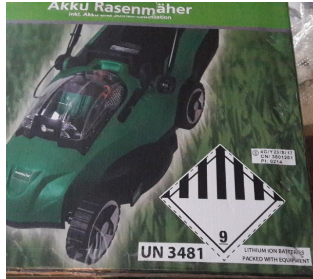
Nr. 9 *)